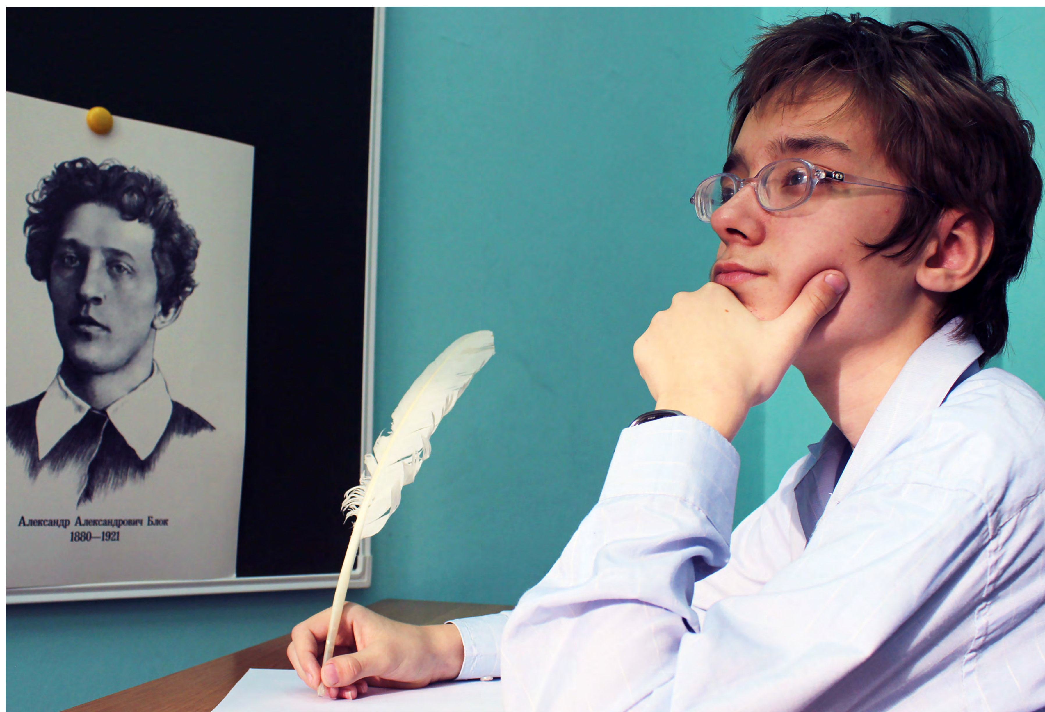
Фото: Евгений Ромашин, школа-интернат № 38, Ростов-на-Дону