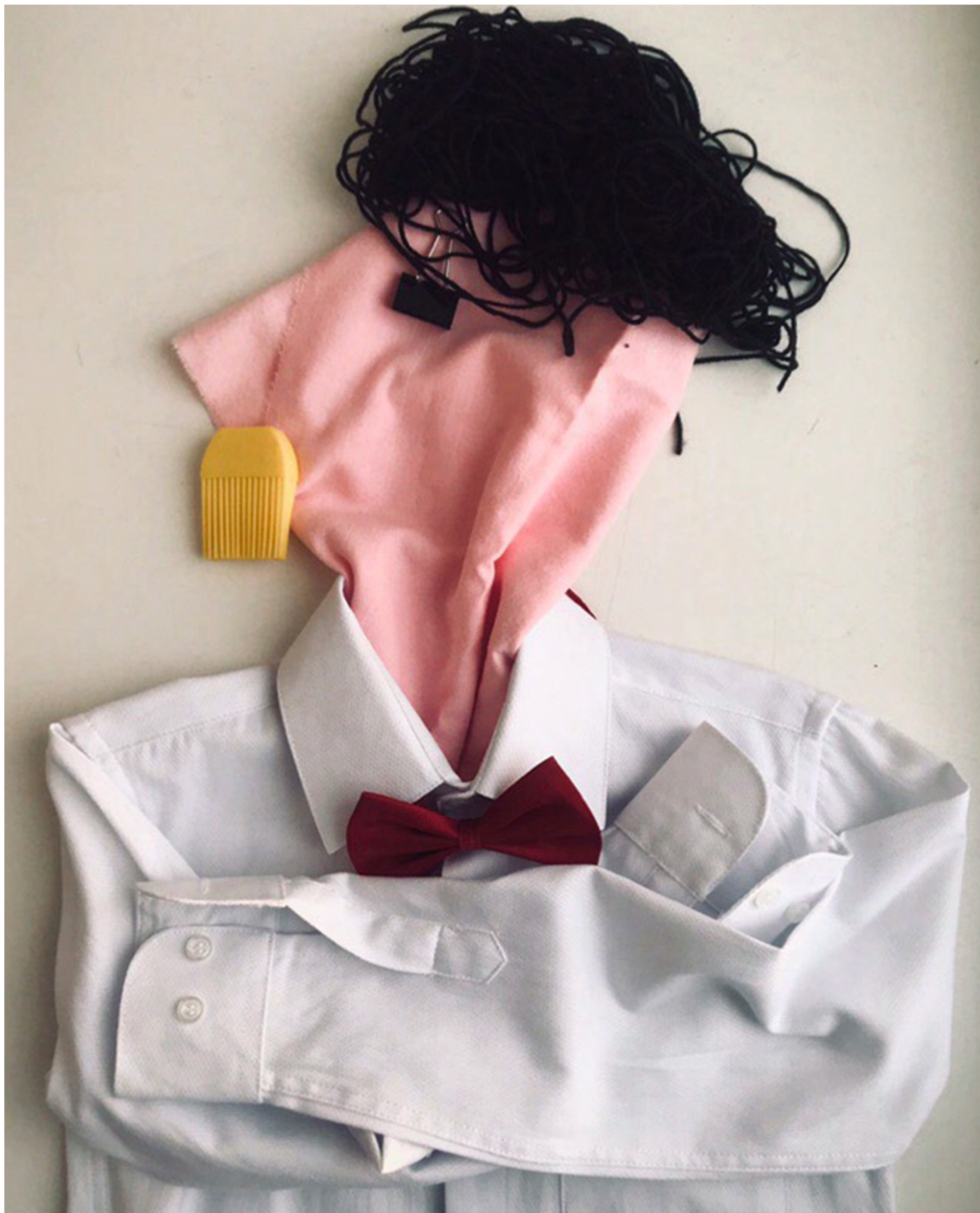
образовательный центр «Горностай», Новосибирск